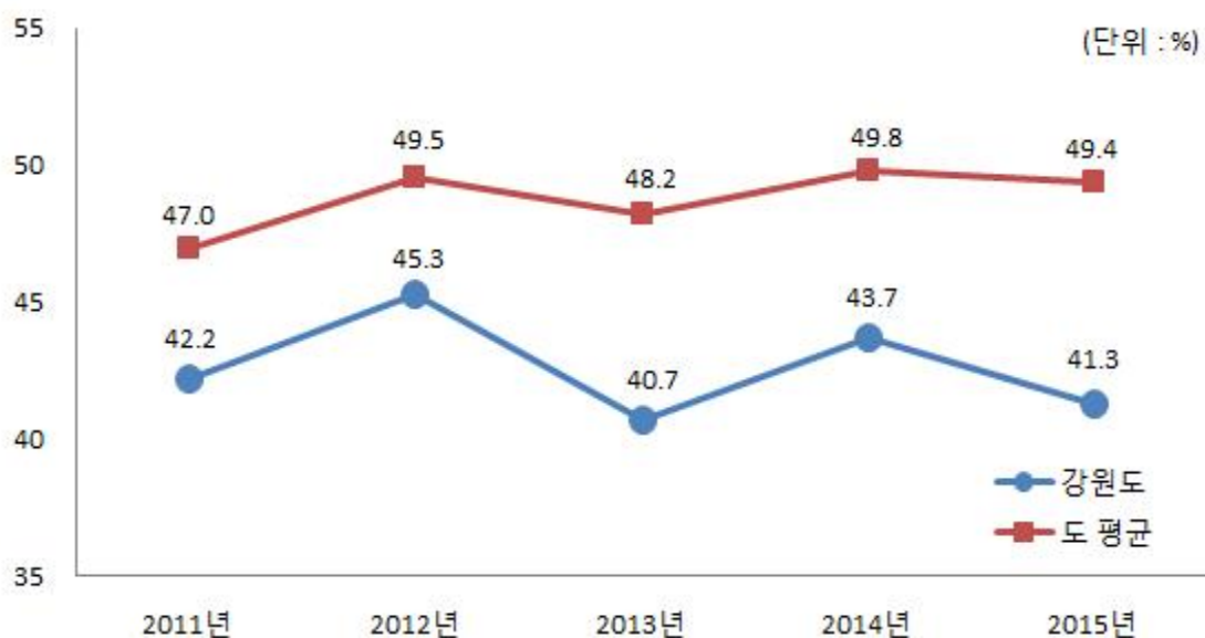
유사 지방자치단체와 재정자주도 비교