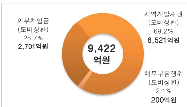
《 잔액 상환재원 》